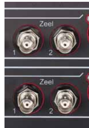
Die BNC-Ein- gangsbuchsen sind hier mit Zeel beschriftet, ein Quellgerät bieten die Schweizer aber nicht an. Die BNC-Ausgangs- buchsen sind zum Anschluss der Endstufe NHB-108 gedacht

digital mit unserem Referenz-CD-Spie- ler Einstein The Source. Netzseitig verkabelten wir mit Wire- world, die sonstigen Verbindungen er- folgten mit Furutech Cinch- und Laut- sprecherkabeln. Als bevorzugte Abhör- lautsprecher dienten uns die ebenfalls in diesem Heft besprochenen A.C.T. C.60 von Wilson Benesch, die hervorragend in