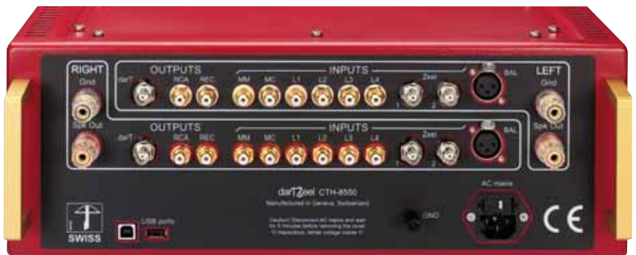
Reichlich Anschlussmöglichkeiten inklusive XLR- und der seltenen BNC-Buchsen aus der Messtechnik

Schauen wir mal auf den stolzen Preis von gut 16000 Euro: Was bekommen Sie dafür? Einen Vorverstärker, eine Phono-Vorstufe und eine sehr kräftige Endstufe. Was Sie im Vergleich zu separaten Bau-